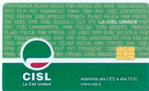
modello tessera card CISL con Microcip

Per poter usufruire delle agevolazioni previste dalla presente Convenzione è necessario esibire la tessera CISL :